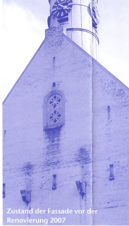
Zustand der Fassade vor der Renovierung 2007

Durch den Rückgang der Kirchensteuermittel kann das Baureferat der Erzdiözese auch dringende Arbeiten nur noch bezuschussen. Die Pfarrei muß jeweils erhebliche Eigenmittel aufbringen und dies oft unvorhergesehen. So begann kurz nach der vermeintlich abgeschlossenen Renovierung un-